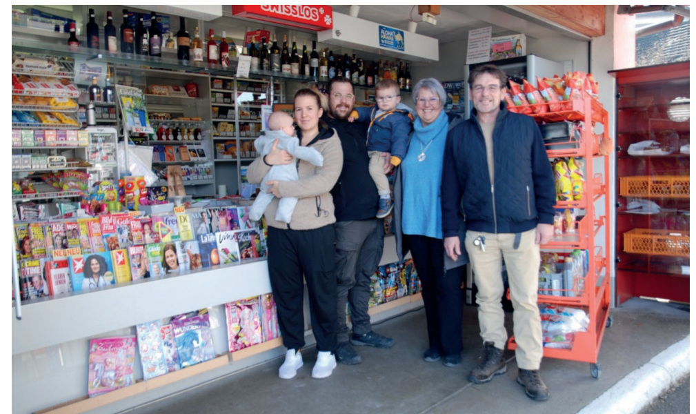
Auszug aus dem Bote vom Untersee und Rhein vom 21.03.2025