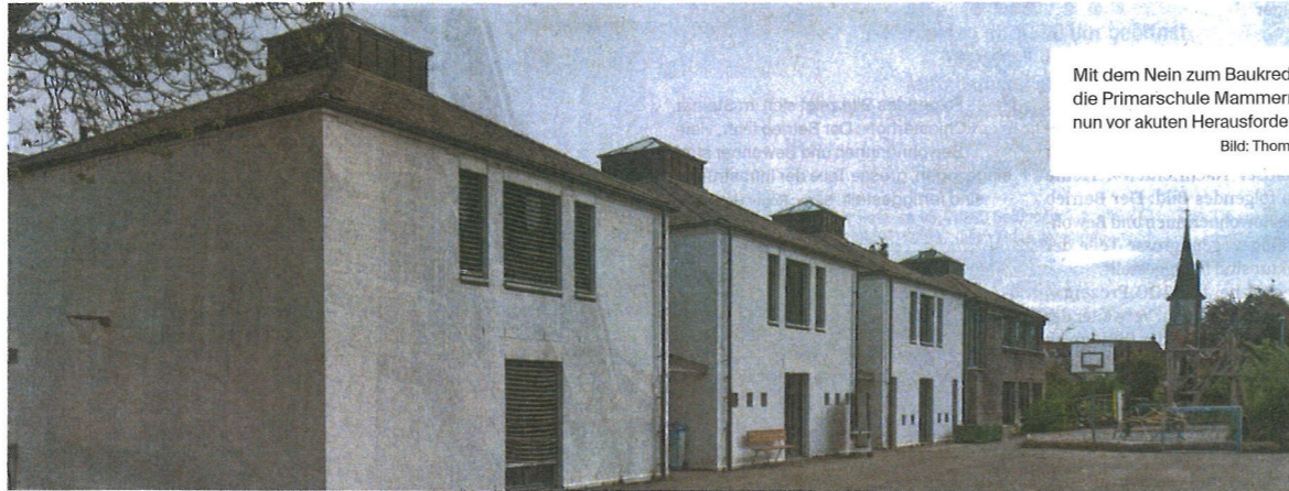
Mit dem Nein zum Baukredit steht die Primarschule Mammern nun vor akuten Herausforderungen.

Er verweist auch auf die Relationen: Die bestehende Schul- und Mehrzweckanlage sei nahezu vollständig abgeschrieben und belaste die Gemein-